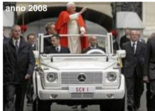
De nieuwe Pausmobiel. De Mercedes fabriek heeft er twee jaar aan gewerkt.

Veel mensen repareren alles met montagekit. God gebruikte spijkers.