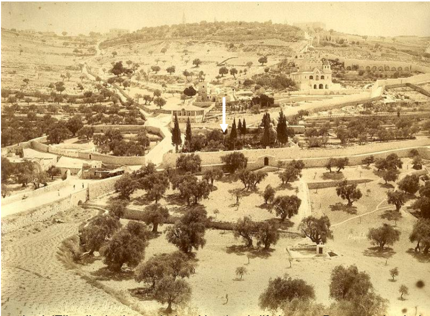
Foto uit 1876 van de Olijfberg, genomen vanuit de stadsmuur van Jeruzalem

Lucas heeft nauwkeurig allerlei mensen geïnterviewd en toen is hem gebleken dat Jezus gewoon was bij het verlaten van de stad naar de Olijfberg te wandelen. Ergens anders vertelt Lucas ons ook, dat Jezus gewoon was overdag in de tempel onderricht te geven en dat Hij de nachten doorbracht buiten de stad op de Olijfberg. ' De Olijfberg was dus één van de meest geliefde plaatsen van Jezus. Ook op de dag van zijn arrestatie begaf Jezus zich net als vroeger naar de Olijfberg nadat Hij met zijn discipelen het Pascha had